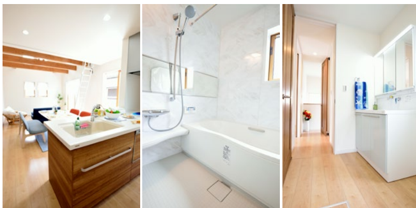
▲同社施工例 ▲完成イメージ図